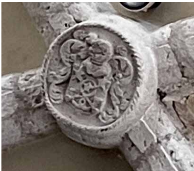
Figure 17 Clé de voûte du chœur Ouest

Les armes du curé-primicier de Clairvaux de 1646 à 1702 Jean CORDELIER est certainement l'autre constructeur de l'abside Ouest. Ce qui en confirme les dates de cette restructuration vers 1660 - 1680.