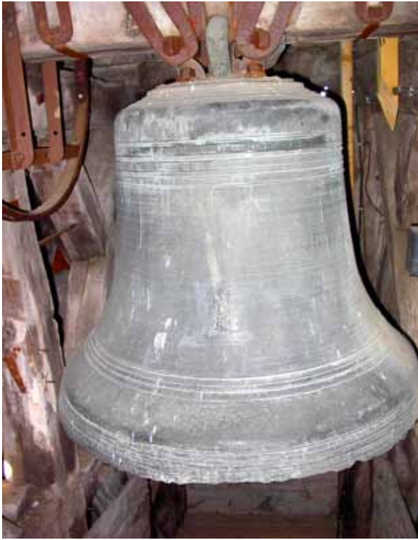
Figure 12 La Marie-Victor dite Marie-Louise avec en bas de la robe, saint Nithier