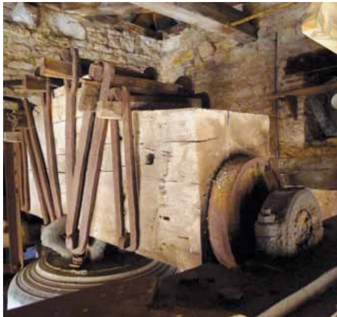
Figure 14 La Marie-Victor dite Marie-Louise son joug et son système d'accrochage