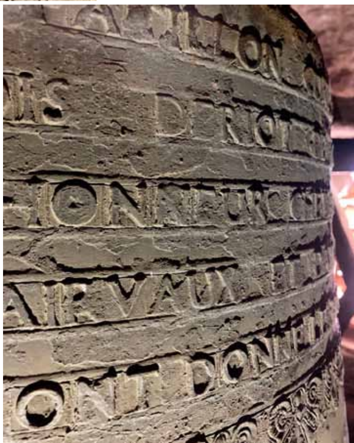
Figure 16 Épigraphe de la Marie - Anne