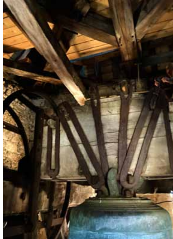
Figure 13 Le joug de la Marie-Victor dite Marie-Louise