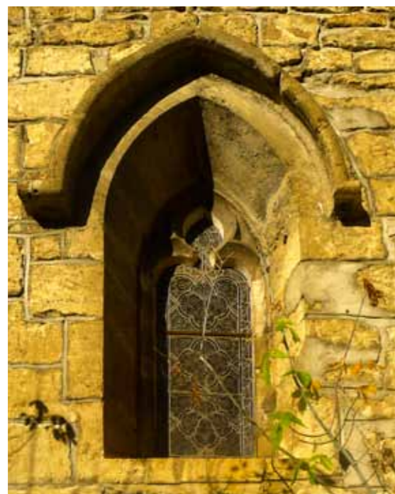
FIG. 1 Fenêtre extérieure du vitrail géométrique © P. Y. D 2017-08

Par le lien entre l'église et la course du soleil, grâce aux vitraux. La rosace nord (à gauche du transept) est toujours dans l'ombre. Les vitraux de l'abside, situés à l'est, prennent vie avec la lumière de l'aube. La rosace sud, placée au midi, se met à parler lorsque le soleil est au plus haut. Enfin, la rosace occidentale qui orne la façade ouest, s'allume avec le soleil couchant. Les couleurs choisies pour ces différents vitraux et le message qu'ils délivrent sont en lien avec les étapes de la lumière.