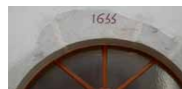
FIG. 3 Porte en plein cintre de l'ex-sacristie 1655

Les quelques analyses exégétiques qui suivent nous y aideront; ce ne sont que des pistes de réflexion.