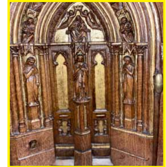
FIG. 134 Tabernacle détail des ébrasements et du trumeau