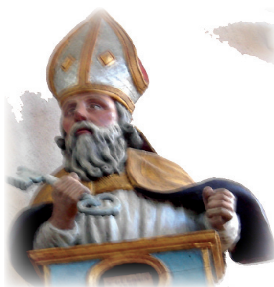
Figure 70 Buste reliquaire du bienheureux Guérin, XVII e siècle, église de Clairvaux