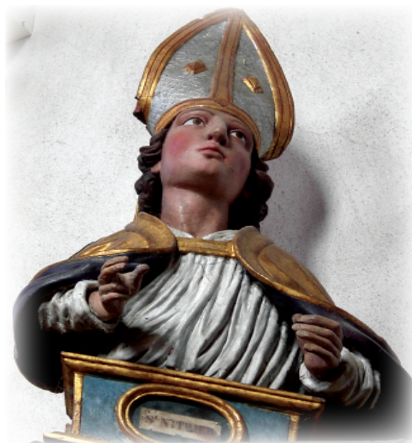
Figure 68 Buste reliquaire de saint Nithier, fin XVII e siècle, patron du décanat de Clairvaux, © PYD 09-2013

[112] JEAN PERRIN texte personnel inédit 11-2016