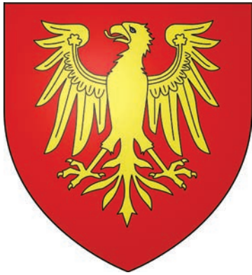
Figure 89 Blason de Jacques de Vienne, seigneur de Lons-gwy ©388 armorial Gelre. De geules à une aigle d'or

Ces deux familles possédaient Lons-le-Saunier , ville divisée alors en deux bourgs appelés, le Bourg de Chalon et le bourg de Vienne, une ville qui battait monnaie.