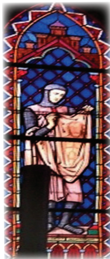
Figure 128 Vitrail du Saint-Suaire au couvent de l'église des Ursulines de Saint-Hippolyte-sur-le-Doubs

À quelle époque avait été fabriqué ce linge, plus exactement, à quelle époque a poussé le lin dont étaient faits les fils? Résultat: