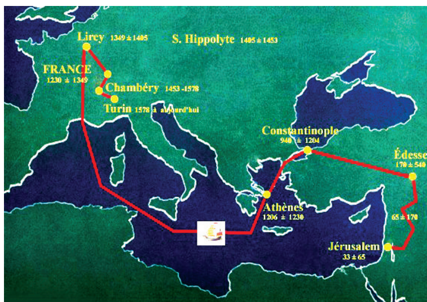
Figure 129 Parcours du Saint-Suaire de Turin

nouvelle église, la Sainte-Chapelle de Chambéry, élevée à la dignité de collégiale par le pape Paul II.