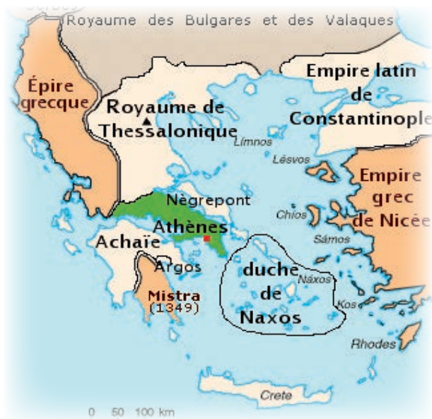
Figure 126 Carte du duché d'Athènes entre 1204-1263 au temps d'Othon de La Roche