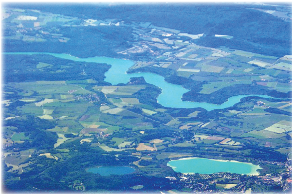
Figure 14 Clairvaux, photo aérienne, vol Lyon-Bruxelles, juin 2015, altitude env. 8 000 m