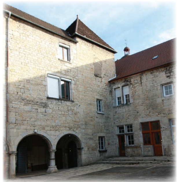
Figure 25 Poligny, hôtel Faulquier