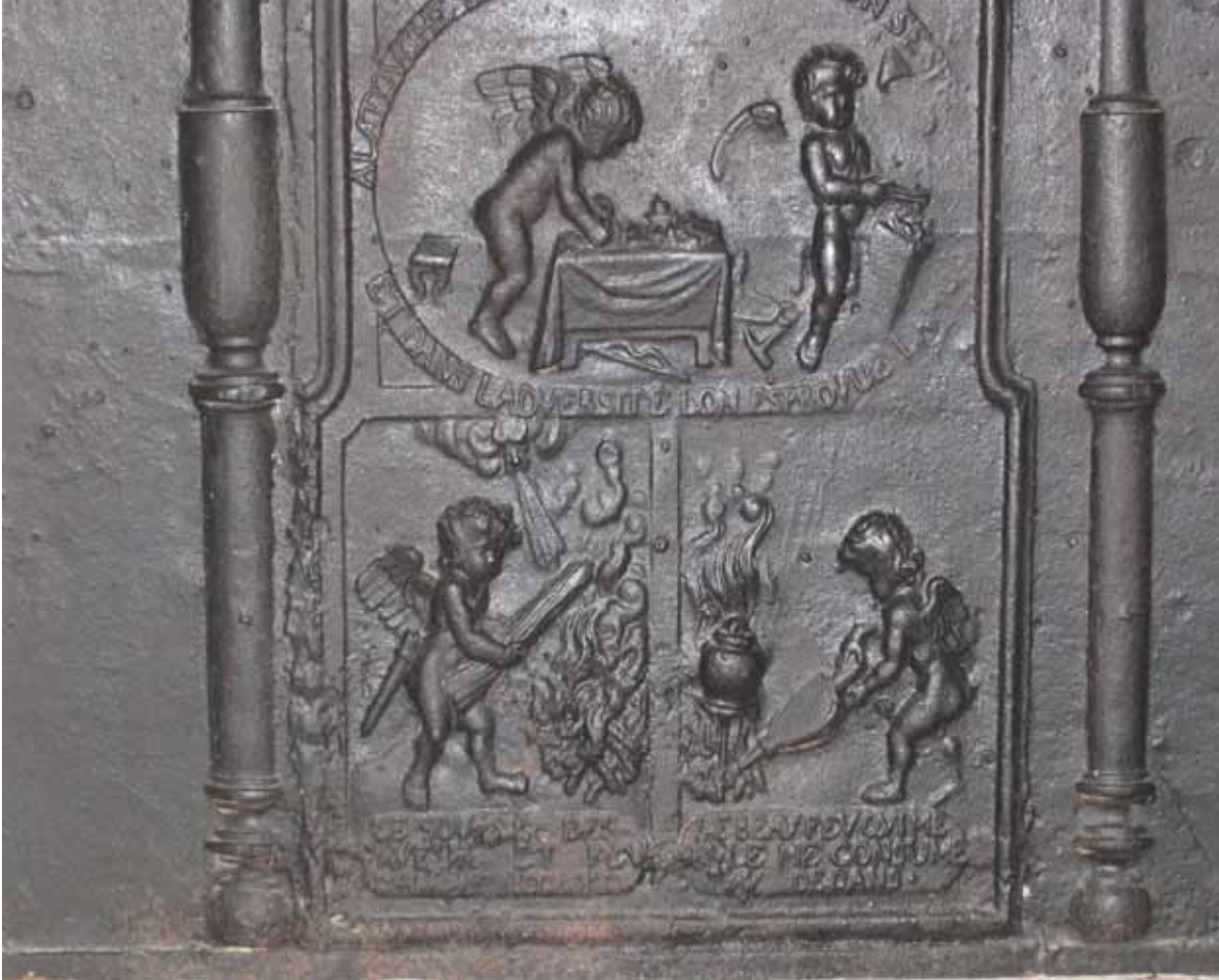
Figure 38 Plaque de cheminée en fonte dans une maison clairvalienne avec décors allégoriques - Forges de Clairvaux XVIII e siècle

Les décors d'angelots avec des inscriptions moralisatrices sont l'une des caractéristiques des Forges clairvaliennes.