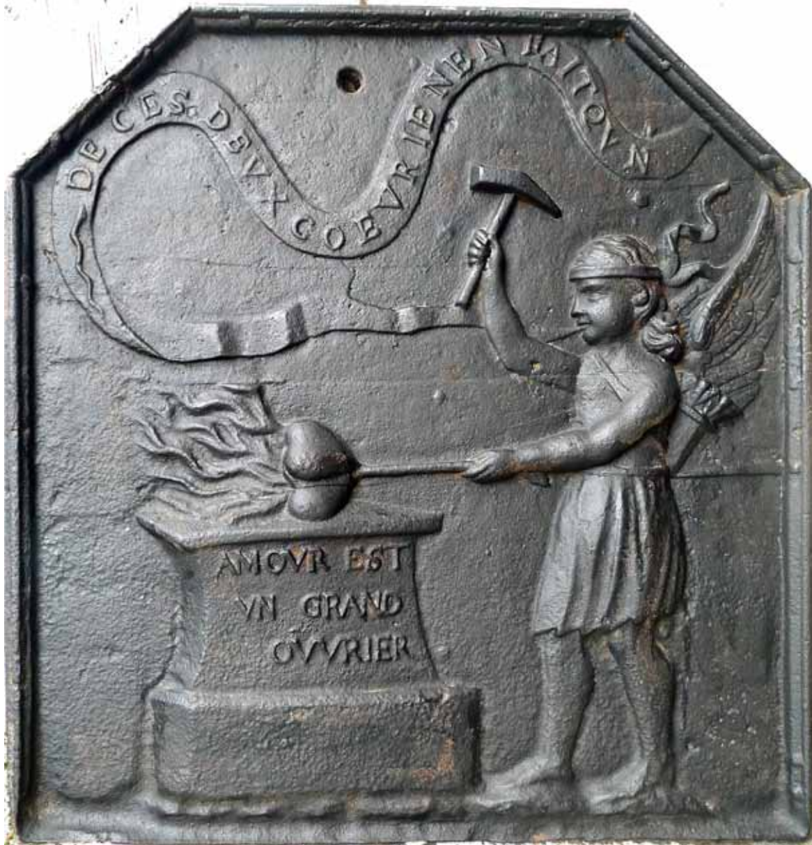
Figure 40 Plaque de cheminée des Forges de Clairvaux, 1 er moitié du XVIII e siècle, maison de Clairvaux

g (randes) (s) I E (l'ouvrier) (e) (L') AMOVR EST VN GRAND OVRRIER