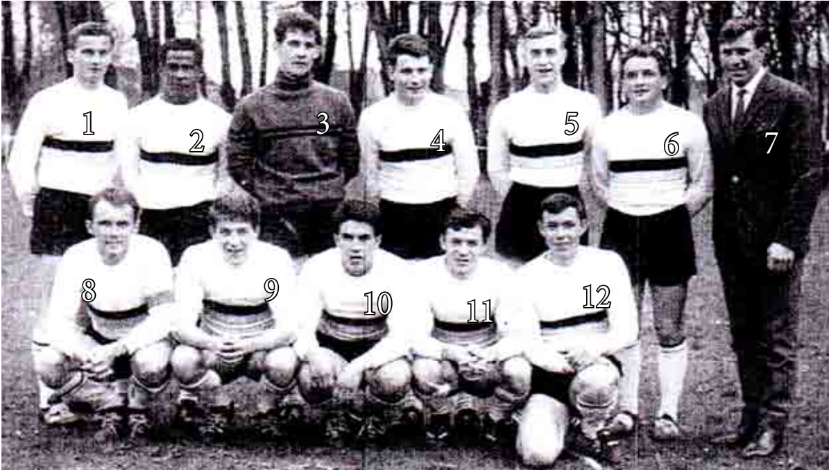
Figure 44 U. S. C. 1963-1964, la... toujours grande équipe