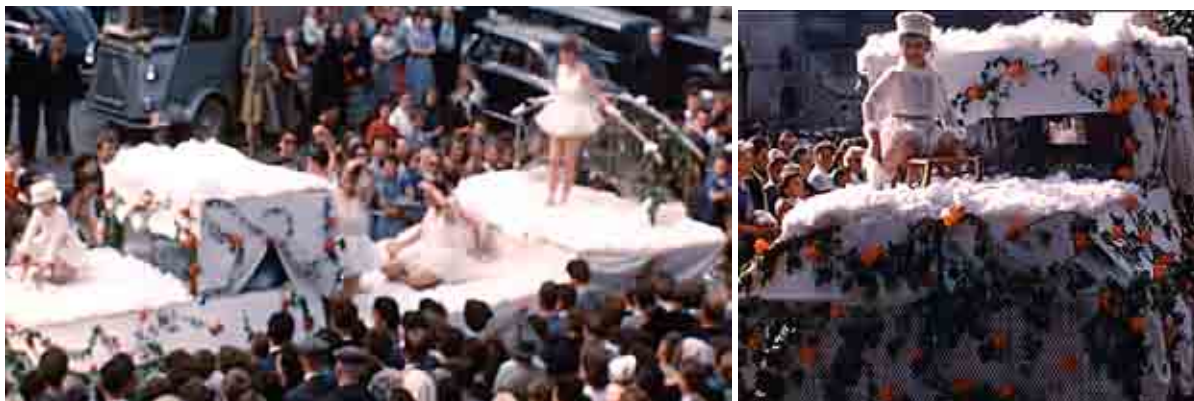
Figure 91 Fête du lac 1954, les patineuses par le Comité des fêtes