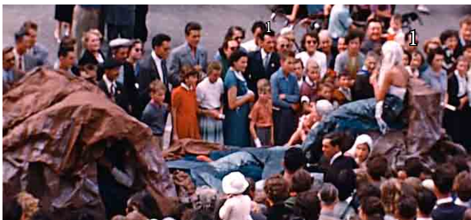
Figure 92 Fête du lac 1954, les sirènes par la Diane clairvalienne