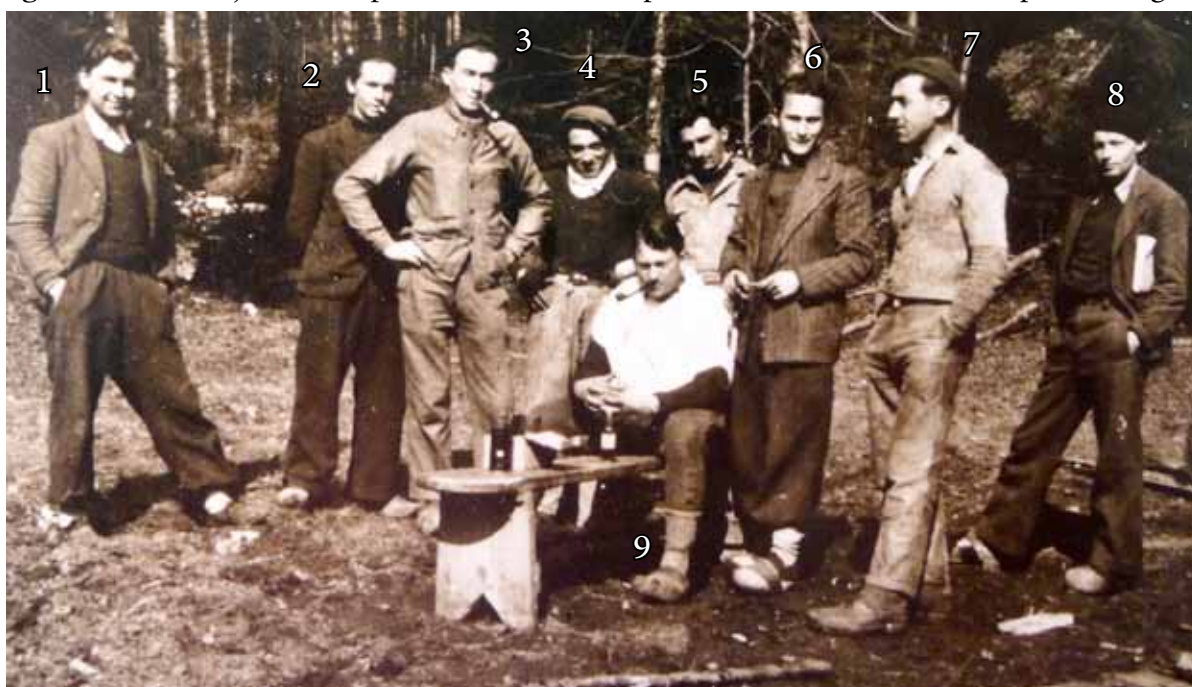
Figure 22 Premier groupe de réfractaires Clairvaliens constitué à Saint-Maurice au Pré à la française, mars 1943