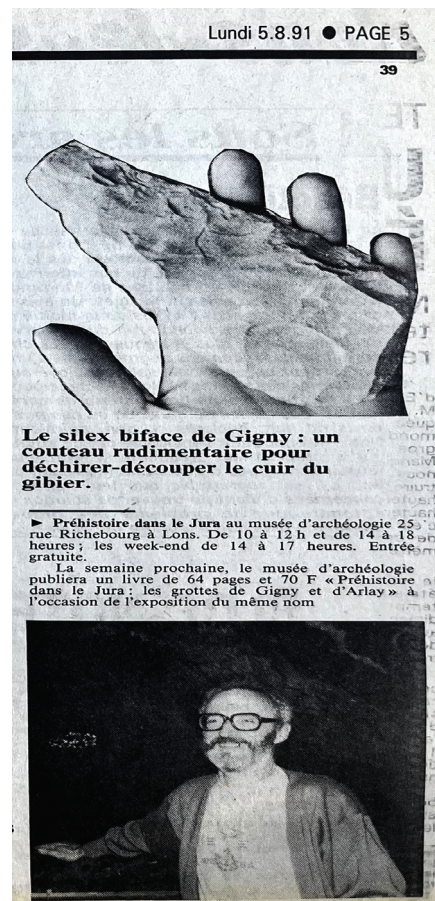
Article (extrait) du Progrès 05-08-1991 pour présenter l'expo. de 1990-91